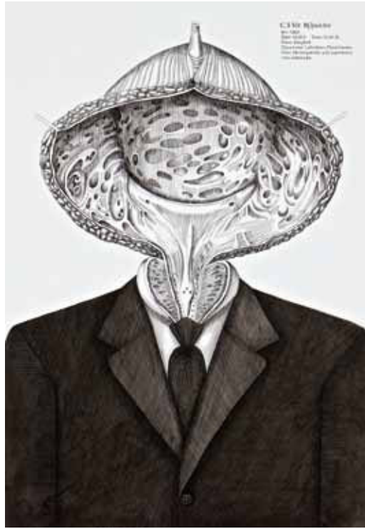
C.5: Mr. B(l)adder, 2012. Ink on paper, Size: 68.5 x 47.5 cm

รับแรงบันดาลใจมาจาก ‘ทรงผม’ ในกลุ่มสตรีชนชั้นสูงที่มักจะตีโป่งตั้งกระบัง ทำให้ทรงผมของเจ้าหล่อนดูพองโตสวยสง่า แต่ในทางกลับกันคำว่า Swollen หรือ Swell นั้นมีความหมายในแง่ลบ โดยศิลปินต้องการเปรียบเทียบให้เห็นถึงความมโหฬาร โอหัง ทะนงตัว โอ้อวด ของเหล่าผู้มีศถาบรรดาศักดิ์ กะโหลกที่ยืดขยายผิดปกติจึงเป็นจินตนาการส่วนตัวของศิลปินที่เข้ามารองรับลักษณะภายนอกและพฤติกรรมเชิงลบของบุคคลประเภทนั้น