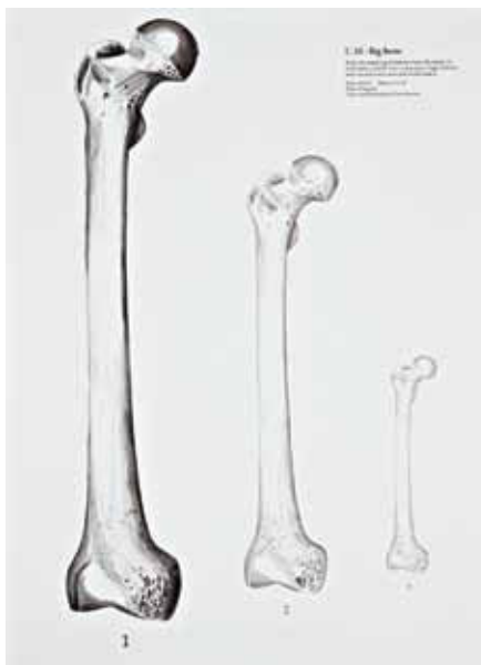
C.12: Homo survival sapiens, 2013. Ink on paper, Size: 84.1 x 59.4 cm