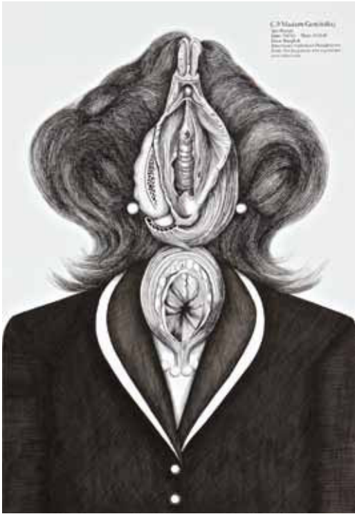
C.9: Madam Gen(itillia), 2013. Ink on paper, Size: 68.5 x 47.5 cm